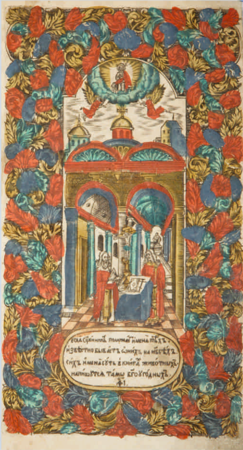
Синодик. Сюжет «Егда священникъ поминаетъ имена...» 1769 г.