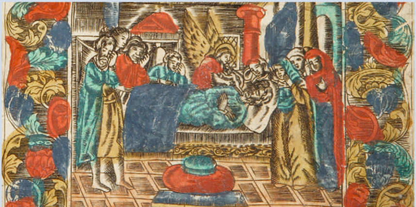
Синодик. Сюжет «Плачу и рыдаю егда помышляю смерти...». 1769 г.