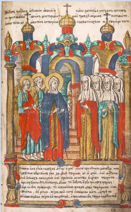
Синодик. Сюжет «Повесть преподобныя игуменни Афанасии...» 1769 г.