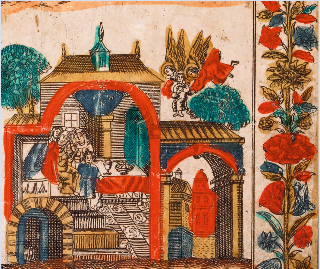
Синодик. Сюжет «Душа разлучившись от своего телесе восприемлема бывает...» 1769 г. Фрагмент

Таким — ТРЕТЬИМ — изданием, на наш взгляд, и является Сиринский синодик Пермской коллекции.