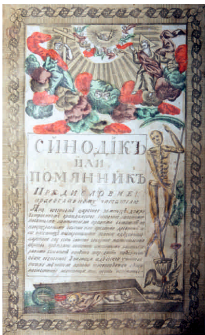
Синодик. XIX в. Один из листов

Синодик поступил в 1923 году из Соборной церкви с. Усолье