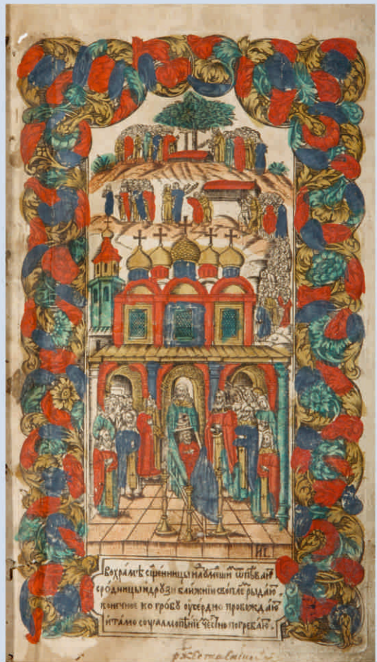
Синодик. Сюжет «Егда душа от теласи разлучает яко птица...» 1769 г.