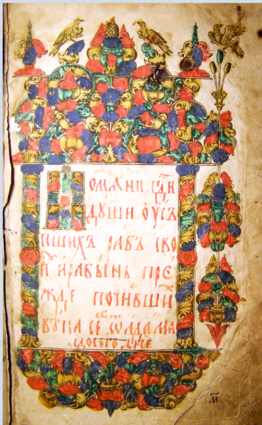
Синодик. «Помяни Господи души усопших...» 1769 г.