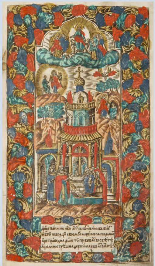
Синодик. Сюжет «Душа паки на небо ангелы возноσιма бываетъ...» 1769 г.