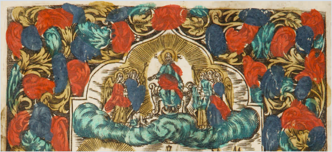
Синодик. Сюжет «Душа паки на небо ангелы возносима бывает...» 1769 г. Фрагмент