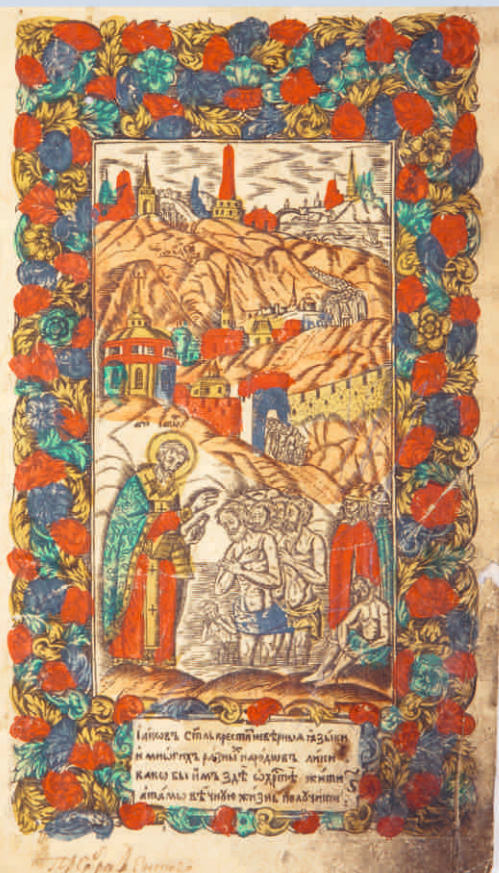
Синодик. Сюжет «Иаковъ сталь крестити / неверныя...» 1769 г.

Состав первого издания гравированного синодика представлял собой 35 гравированных сюжетов и был издан в 1700 году. Иллюстрации к этому изданию выполнили Тепчегорский, Трухменский, Андреев и Л. Бунин.