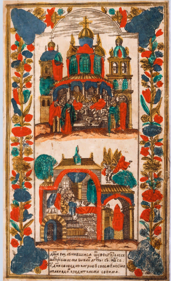
Синодик. Сюжет «Душа разлучившия от своего телесе восприемма бывает...» 1769 г.

временем утрачивались, поэтому возникала необходимость готовить новое издание. Для этого следовало печатать новые листы с тех же досок, что были награвированы ранее, или, по необходимости, заменяя гравированные формы новыми, или гравировать новые сюжеты. Так появились переиздания синодиков 1700 года.