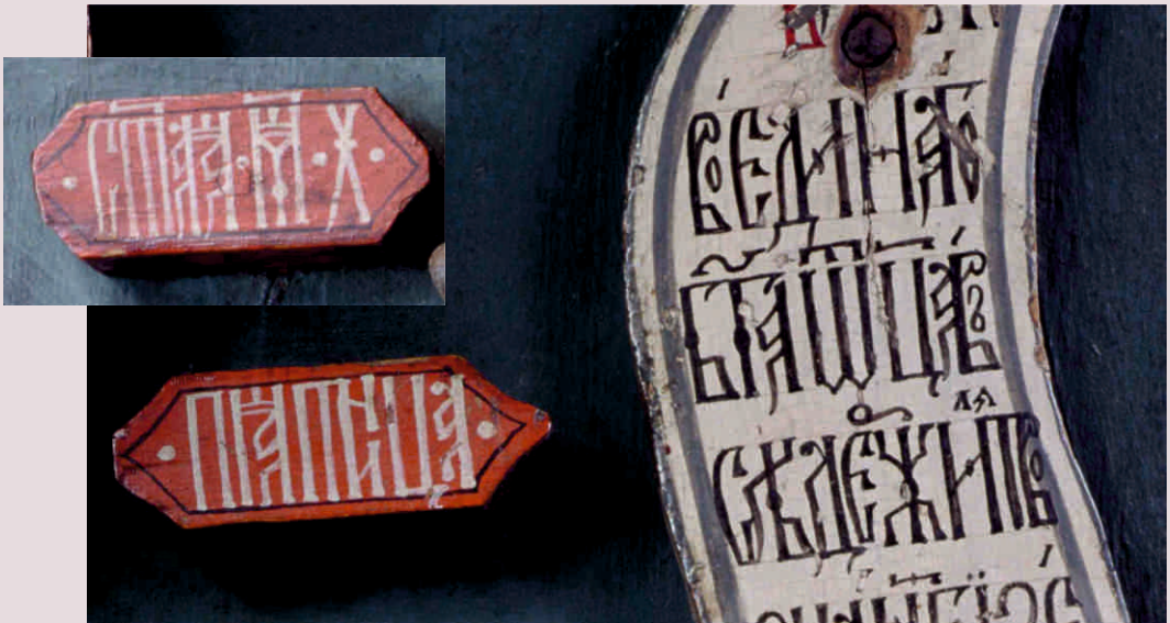
Свиток «Символ веры», таблички с именем святой. Фрагмент иконы