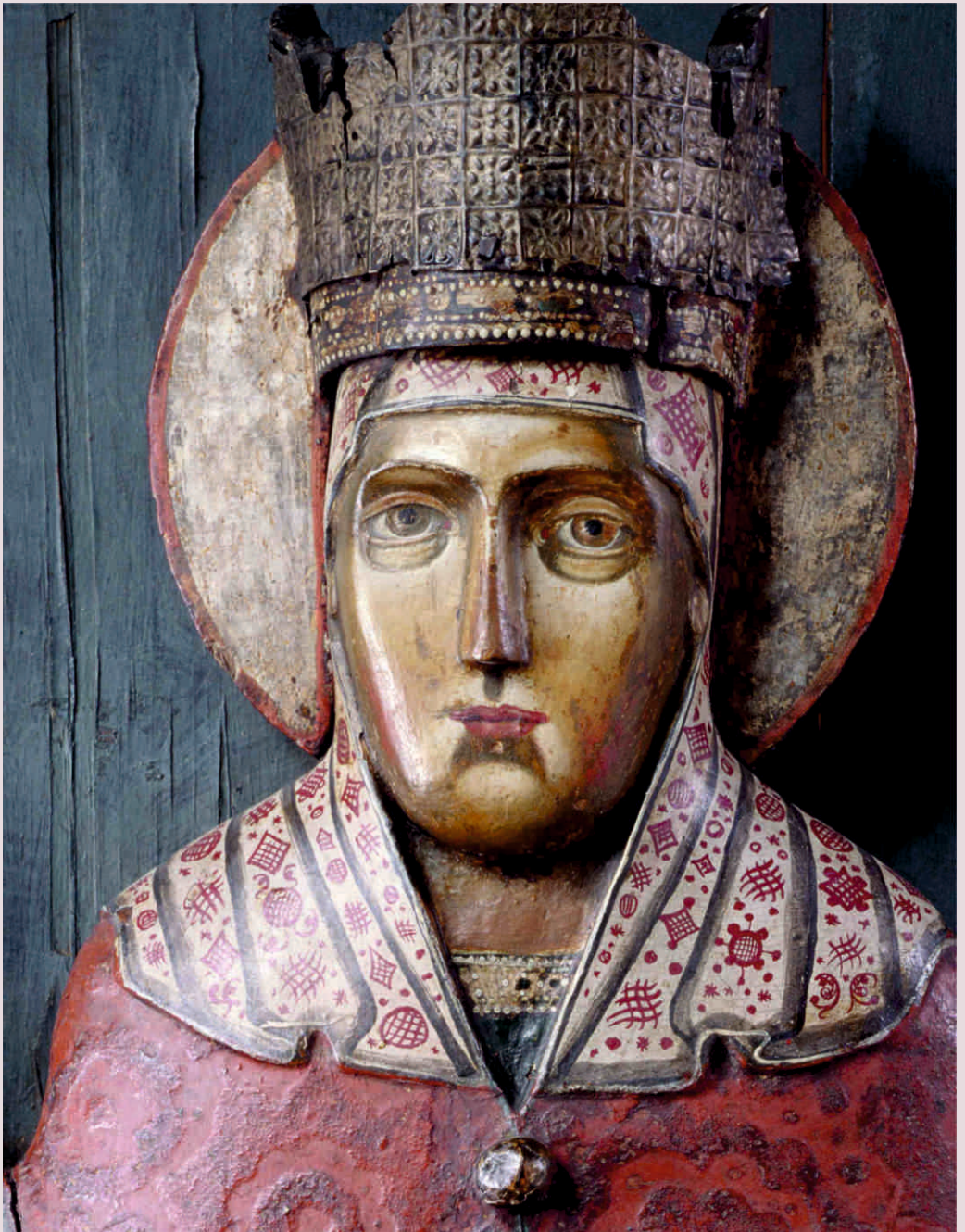
Лик святой Параскевы Пятницы. Фрагмент иконы