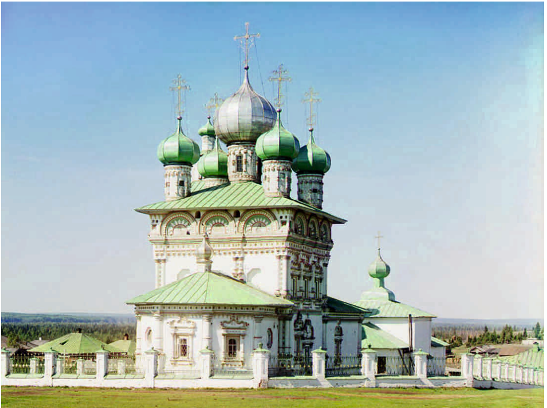
Храм во имя Святого Николая Чудотворца в с. Ныроб. 1912 год.

Главную стену в часовне занимали пять деревянных скульптур. А ведь они не должны бы здесь находиться... Особенно удивила меня фигура Христа с лицом татарина...»