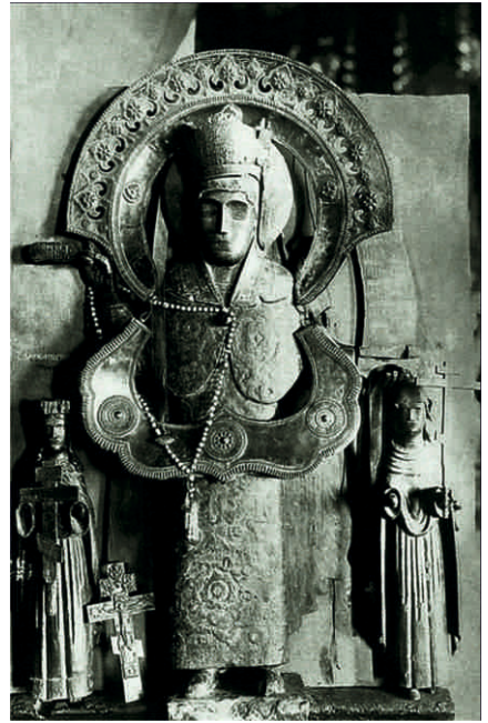
Святая Параскева Пятница с предстоящими великомученицами Екатериной и Варварой.

Интереснейший пример такого слияния традиций находим в Пермском крае. На древнем Искорском языческом городище-святилище после христианизации Перми Великой естественным образом продолжает формироваться и развиваться культ великомученицы Параскевы