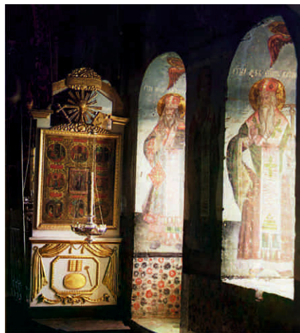
Фрагмент интерьера Никольского храма в с. Ныроб. 1912 год.

Один из главных символов Пермского края — коллекция деревянной скульптуры «Пермские боги». Это поистине уникальная скульптура