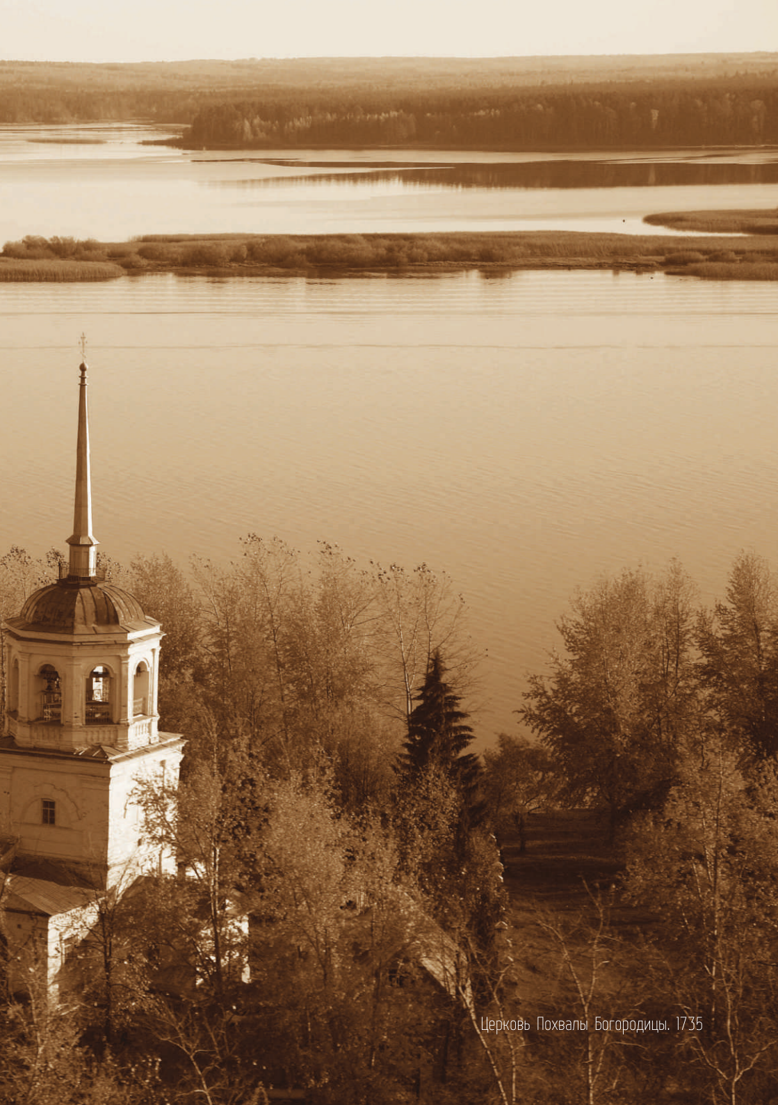
Церковь Похвалы Богородицы. 1735