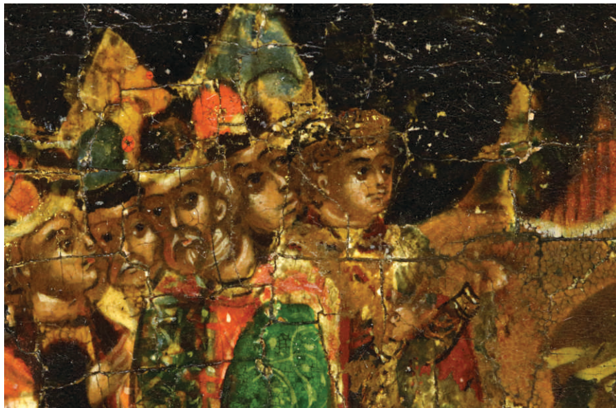
Богоматерь Владимирская с лицевым сказанием о чудесах иконы Клеймо Ю. Совет Темир-Аксака со своими старейшинами. Фрагмент