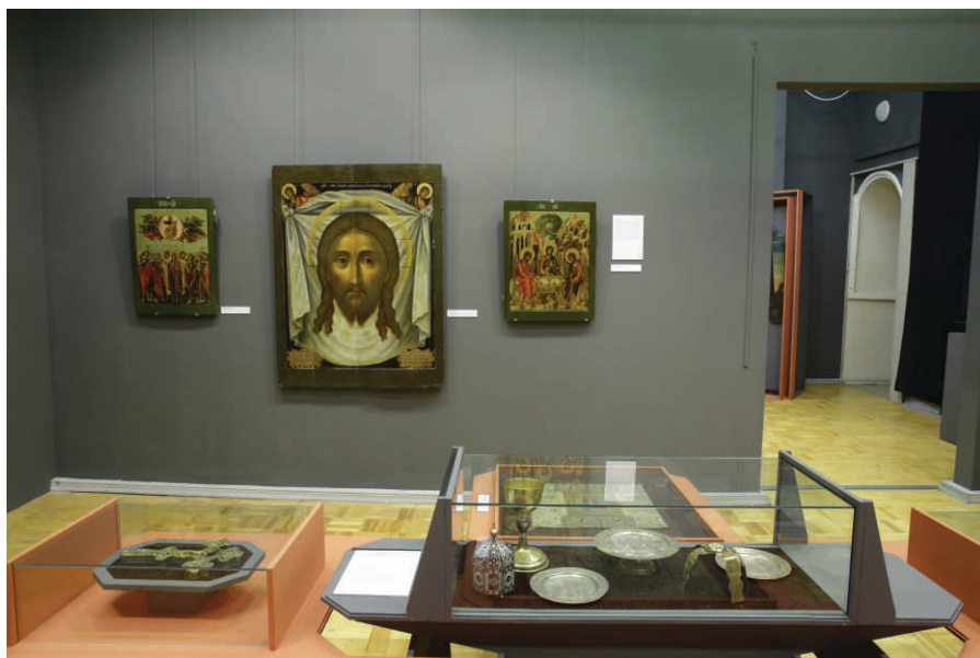
Экспозиция выставки «Строгановы: Отечеству – богатство, себе – имя». Фрагмент

«Пермский путь» Строгановых (предприниматели и купцы – «именитые люди» – бароны Российской Империи): от начала формирования их собственной «империи», то есть со времени получения в 1558 году первой Жалованной грамоты царя Ивана Грозного на владение многими землями – до 1722 года, когда Строгановы за заслуги перед отечеством получили титул баронов.