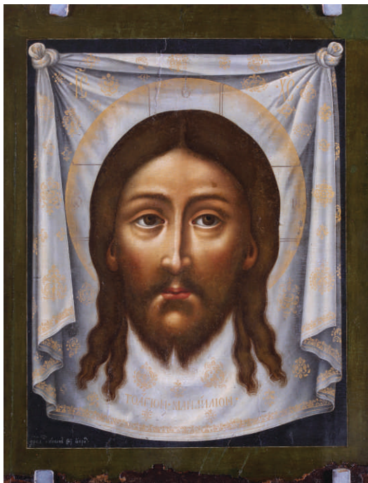
С.Ушаков (?) Спас Нерукотворный. 1676 Дерево, темпера, золочение Пермская художественная галерея