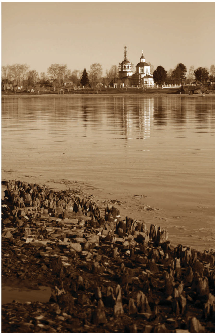
Остатки бывших ограждений Орла-городка