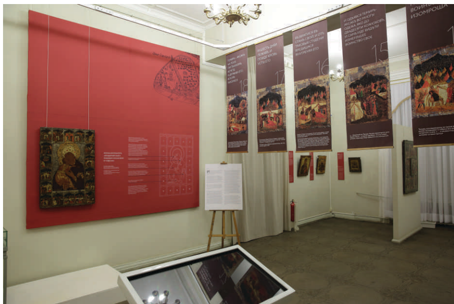
Экспозиция выставки одной иконы «... и от великой пагубы избави нас...». Фрагмент