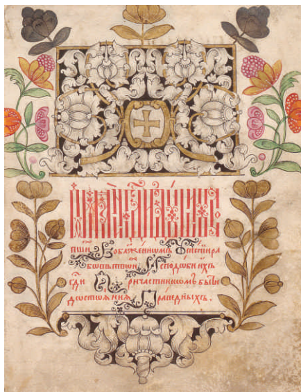
Синодик. Рукописная книга. 1703. Концовка, заставка глав Пермская художественная галерея