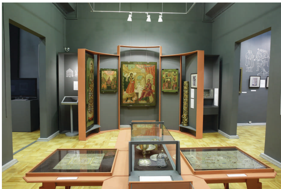
Экспозиция выставки «Строгановы: Отечеству – богатство, себе – имя». Фрагмент