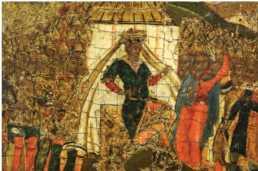
Богородица Владимирская с лицевым сказанием о чудесах иконы Клеймо I. Темир-Аксак, пришедший на русскую землю в 1395 г., восседает на троне. Фрагмент