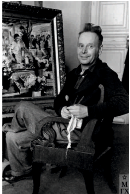
Юрий Иванович Пименов в мастерской

Юрий Иванович Пименов был счастлив в творчестве. Даже в XXI веке, в наше переменчивое время, когда сменились приоритеты и ценности, многие помнят и любят